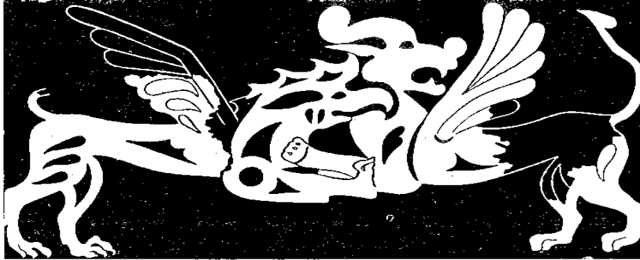
Altaylarda, Pazırık kurganından gün ışığına kavuşturulan bir eyer örtüsünde, kartal ve aslan grifonlarının mücadele sahnesi.