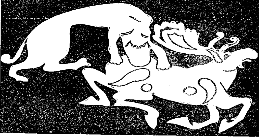
Altay dağlarında, birinci Pazırık kurganından çıkarılan deriden yapılmış bir eyer süsü. Kaplanın bir Sığın'a saldırma sahnesi, deriden kesilerek örtüye applike edilmiş.