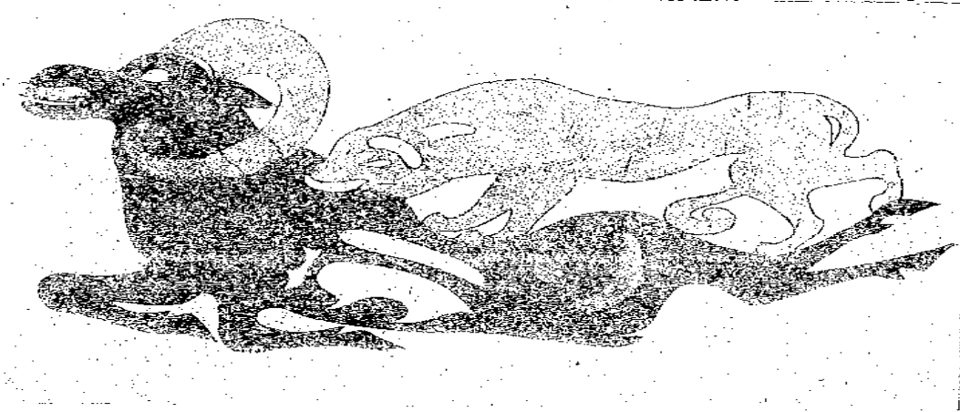
Altaylarda, İkinci Pazırık kurganından gün ışığına kavuşturulan bir eyer örtüsü üzerinde, kaplan ya da pارسın bir dağ koyununa saldırış sahnesi canlandırılmış.

Örtünün üzerinde ince bir deriden kesilerek yapıştırılmış hayvan mücadele sahnesinde bir kaplanın sığına saldırırken betimlendiği görülmektedir. Kaplanın saldırısına uğrayan sığın, kaplanın pençelerinin ağırlığı ile dört ayağının üzerine çökmüş olarak betimlenmiştir. Söz konusu sahnede sığının, yassı ve geniş boynuzlarını arkadan gelen tehlikeyi uzaklaştıracak şekilde geriye doğru uzatmış bir şekilde tasvir edildiği anlaşılmaktadır (Diyarbakirli, 1972:127).