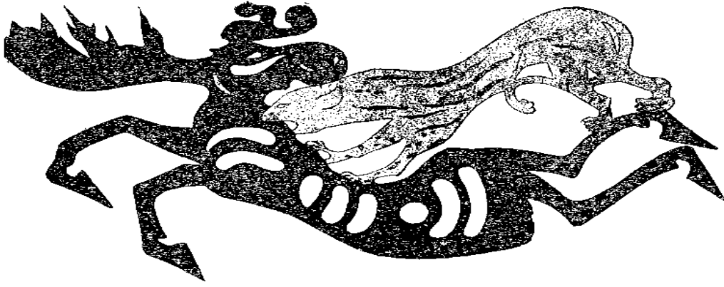
İkinci Pazırık kurganından çıkarılan bir eyer örtüsü. Kaplanın veya pارسın sığına saldırısı.