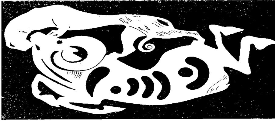
Bir eyer örtüsü üzerinde görölen, kaplan ya da porsin bir dađ koyununa saldırışı. Birinci Pazırık kurganı, Altaylarda.