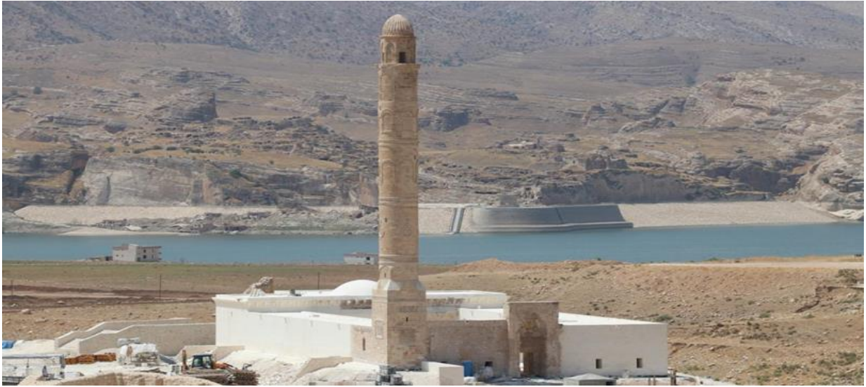
Resim 2.3. Er-Rızık camii

Cami 1409 yılında Eyyûbi Hükümdarı Sultan Süleyman tarafından yaptırılmıştır. Caminin Güneydeki ibadet bölümü heyelan yüzünden nehre uçmuştur. Bugün caminin sadece harimin kuzey duvarı ve avlu giriş cephesi, Taç kapı ve minaresi sağlam ulaşabilmiştir. Cami Aynı zamanda kuzeydoğu köşesinde bitişik yüksek prizma kaide üzerinde silindirik gövdeli minare küçük mozaikler halinde kesilmiş renkli taşlar ve kakma tekniği kullanılmış geometrik desenlerle yapılmıştır. Minarenin şerefesine iki ayrı merdivenle ulaşabilmektedir. Minare kufi hatlı Arapça yazılar yazılmıştır. İleri düzeyde bir taş işçiliği kullanılmıştır. Cami 1953'te yapılan onarımlarla beraber kuzey revakın önü duvarla kapatılarak ibadet yeri olarak kullanılmıştır. Günümüzde minare Türkiye'nin ilk ve tek çift merdivenli cami minaresi olma özelliğine sahip 1700 tonluk minare Kültürel Park'a taşınmıştır (Hasankeyf Kaymakamlığı).