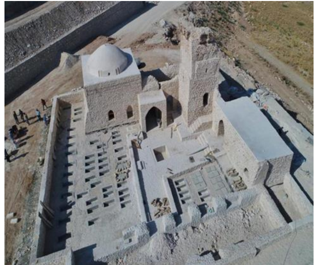
Resim 2.4. İmam Abdullah Zaviyesi