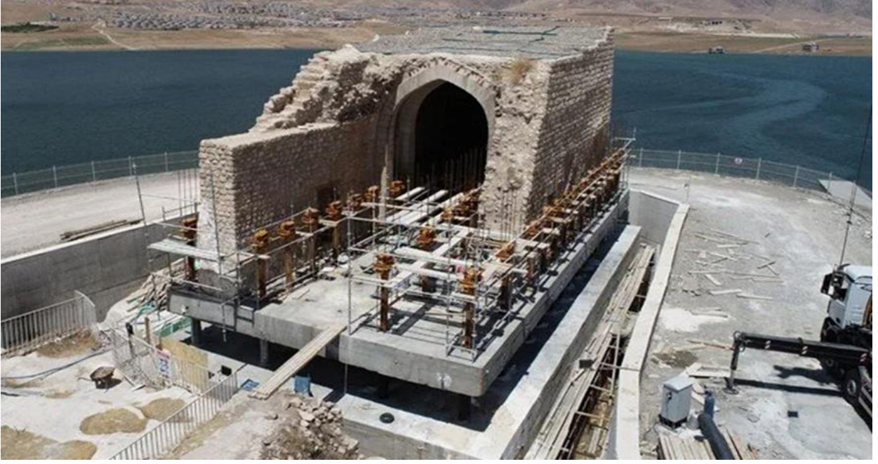
Resim 2.6. Küçük saray