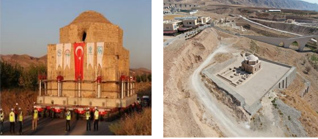
Resim 2.7. Artuklu hamamı