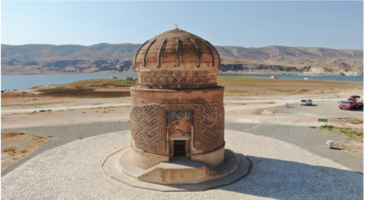
Resim 2.2. Zeynel Bey türbesi

İlisu Barajından dolayı su altında kalacak olan türbe 12 Mayıs 2017 tarihinde bulunduğu yerden özel bir sistemle 2 kilometre uzaklıktaki Hasankeyf'in Yeni Kültürel Park Alanı'na taşınmıştır.