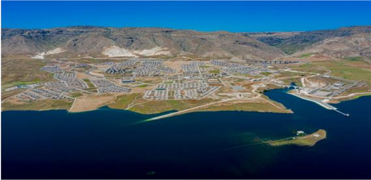
Resim 2.1. Hasankeyf'ten bir görünüm