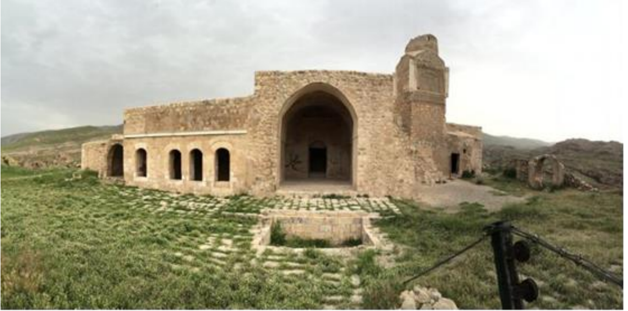
Resim 2.5. Ulu Cami